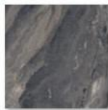
MARMO GRIGIO SC 6074