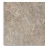
EMPERADOR LIGHT 1465