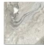
MARMO GRIGIO CH 6075